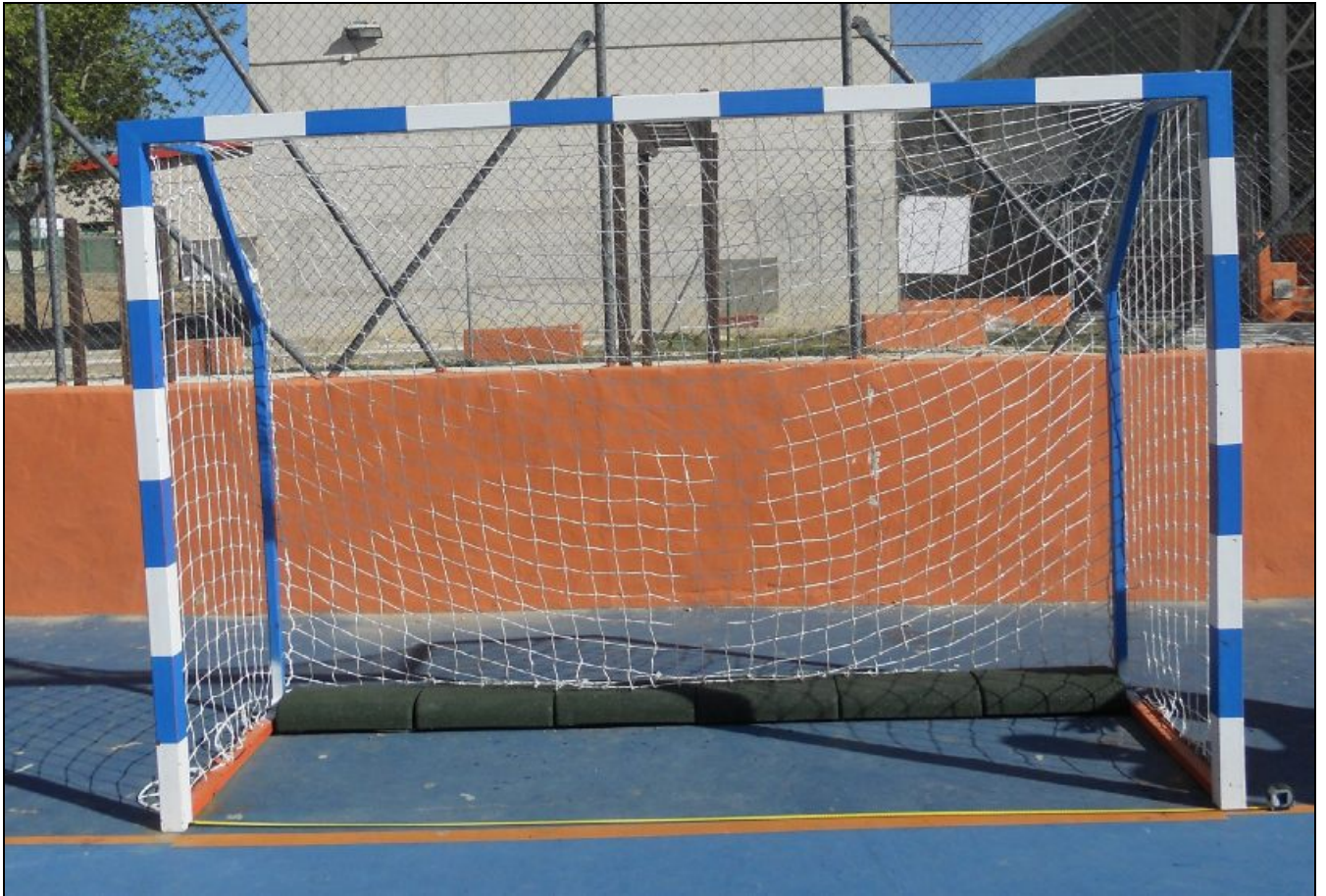
Portería con contrapeso