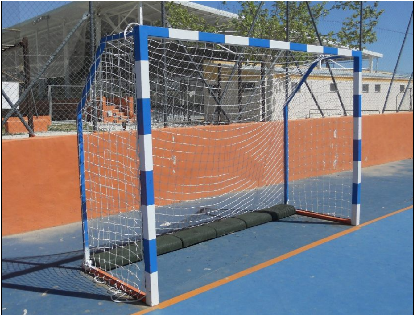
Portería con contrapeso vista lateral