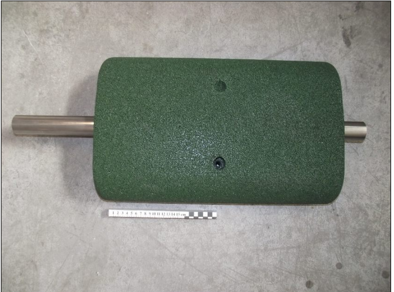
Detalle del material utilizado como contrapeso.