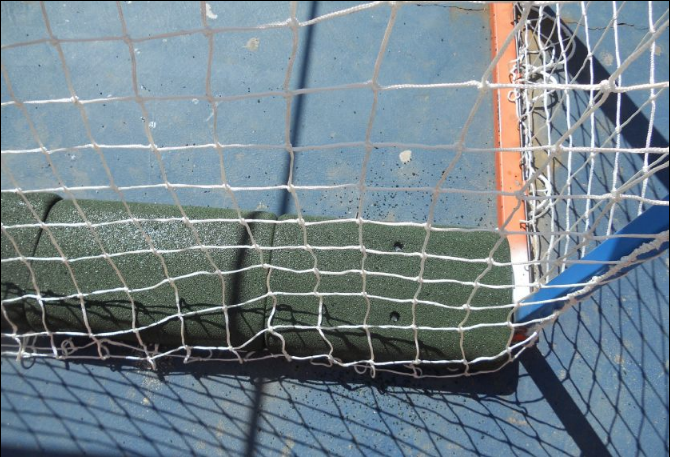
Detalle del contrapeso